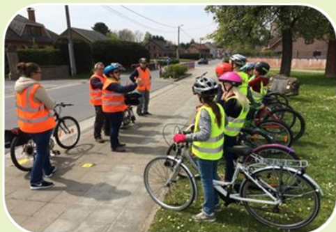
Des formations pour rouler à vélo