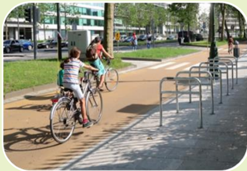
Des infrastructures qui permettent à tou·te·s de se déplacer à vélo