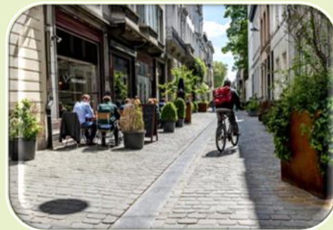
Un environnement sûr pour se déplacer à vélo