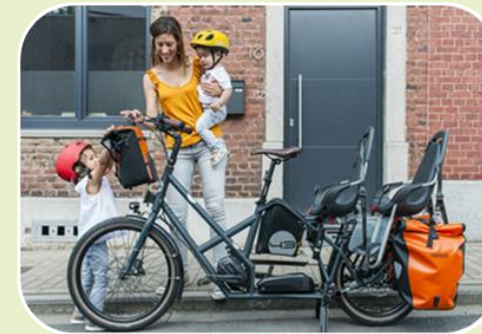
Des solutions vélo adaptées à ses besoins