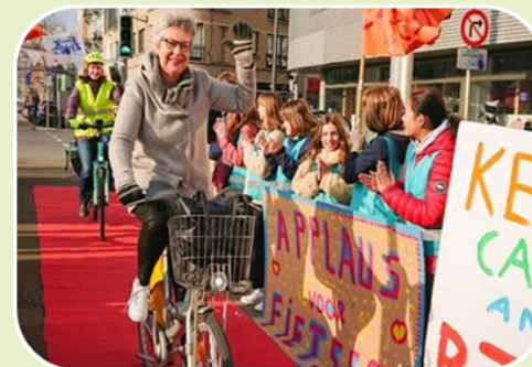
Un encouragement au shift mental et modal