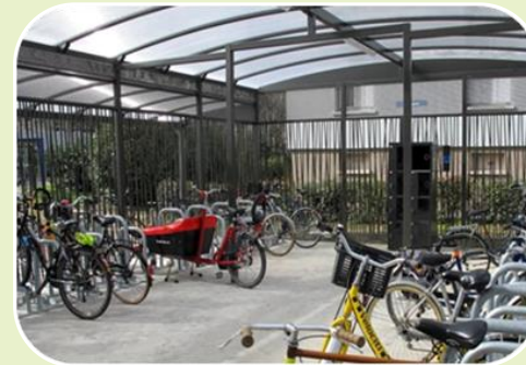
Stationner son vélo sans crainte du vol