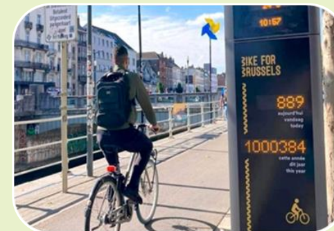
Des politiques cyclistes adaptées