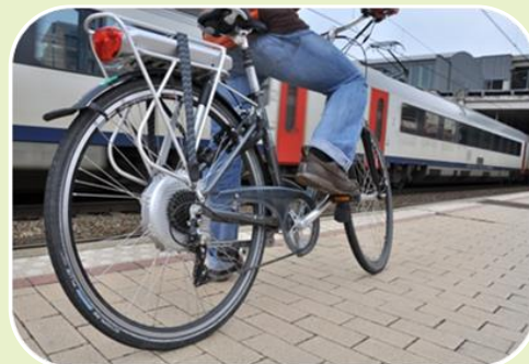
Une combinaison vélo + transports publics facilitée